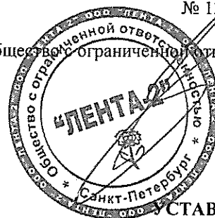
УСТАВ Общества с ограниченной ответственностью «Лента» (четвертая редакция)

"УТВЕРЖДЕН" Решением единственного участника № 131-Л от 27 февраля 2014 г. Единственный участник: Общество с ограниченной ответственностью «Лента-2»